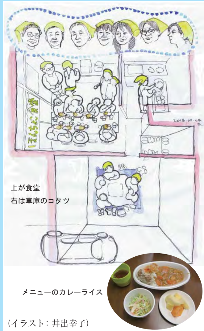
(イラスト: 井出幸子)

池袋本町郵便局の隣、もとは囲碁教室だった場所で活動しているほんちょこ食堂をお訪ねしました。