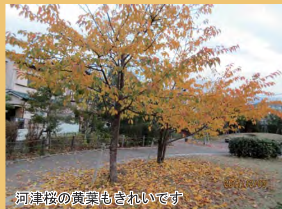
河津桜の黄葉もきれいです