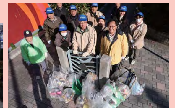
今年度(平成29年12月)のごみの量