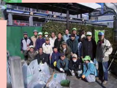
8年前(平成21年)のごみの量