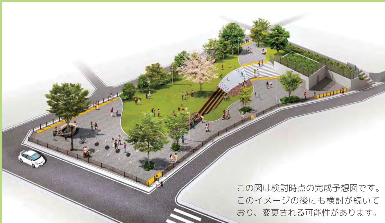
この図は検討時点の完成予想図です。このイメージの後にも検討が続いており、変更される可能性があります。