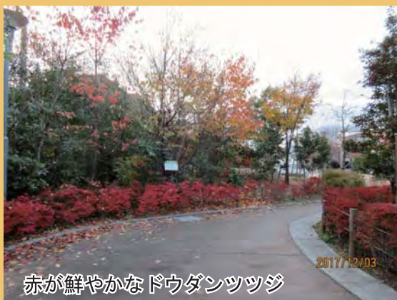
赤が鮮やかなドウダンツツジ

電車の見える公園が開園して5年目を迎えようとしています。参加者が手植えしたいのちの森はすくすくと育ち、駅が見えなくなりそうです。公園に植えた樹木も、秋にはきれいな紅葉が楽しめるようになってきました。今一度景色をお楽しみください。